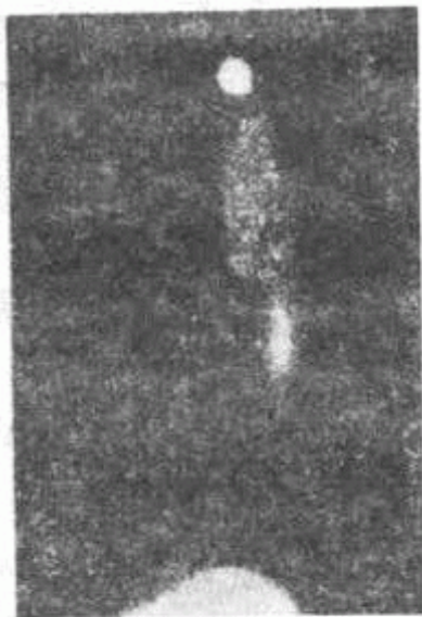
Рис. 15.—Шарь мысли при раздвоении.

Я полагаю, что фотография духов, т.е. призрака мёртвых, возможна в некоторых исключительных случаях, но я тоже полагаю, что 98 и, может быть, 99 процентов их — подложные. Я считаю, что действительные фотографии обусловлены присутствием астрального тела умершего, достаточно материализовавшегося для отпечатывания пластинки; То же самое относится и ко всем привидениям.