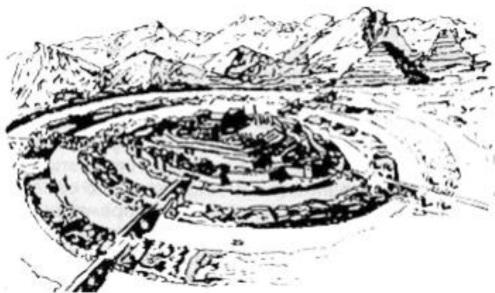
Реконструкция Города Золотых Врат по произведениям Платона. Акрополь окружают водные и земляные кольца.