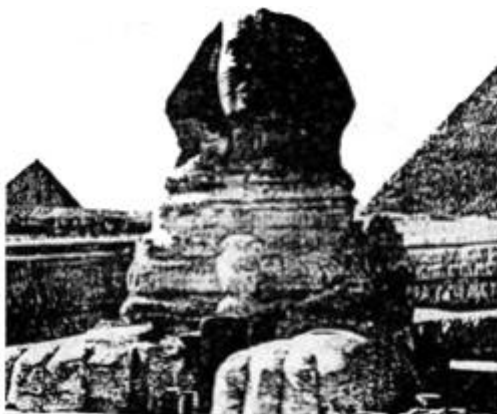
Сфинкс рядом с пирамидами на плато Гиза. Ясновидящий Э.Кейси утверждает, что информация об Атлантиде будет найдена в основании левой передней лапы Сфинкса, в круглом камне основания этой лапы.

Потомки атлантов создали цивилизацию в Египте и в Америке. Их стараниями были построены пирамиды в Гизе и Сфинкс, лицо которого являлось копией облика одного из правителей Атлантиды 11 . Существуют и многочисленные сведения об Атлантиде, полученные через американского ясновидящего Эдгара Кэйси.