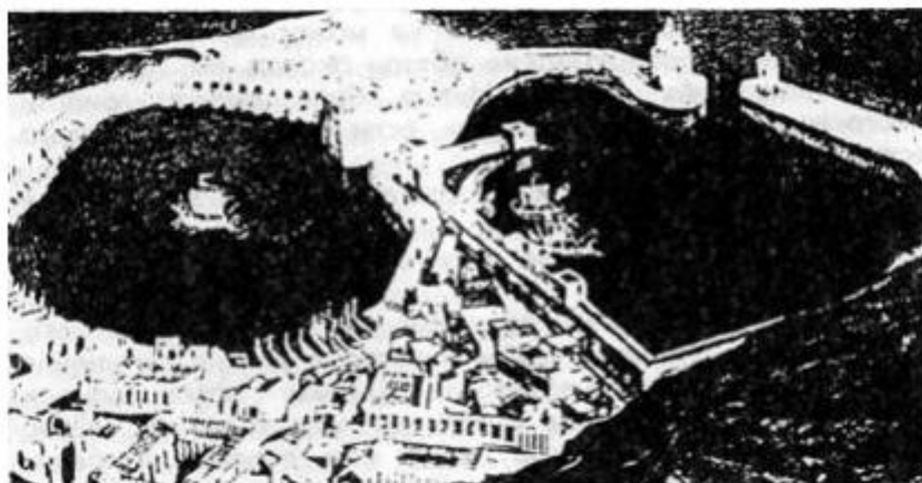
Реконструкция древнегреческого города Аполлония, который опустился под воду после землетрясения

Она узка и со всех сторон заокруглена и так высока, что ее вершину не видно, так как она всегда окутана туманом, и зимой и летом. Местные жители говорят, что она упирается в небо. От нее и получили название местные жители, которых называют атланты. Говорят, что они не едят ничего живого и не видят снов».