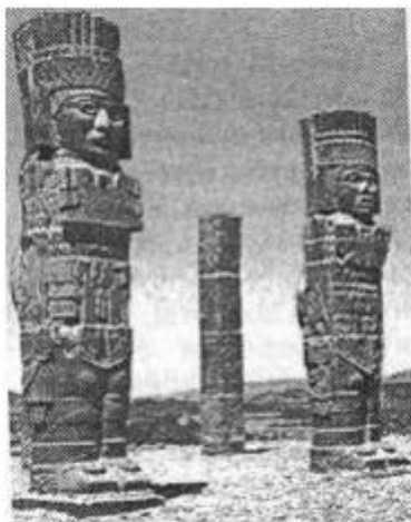
«Фигура Атланта» мексиканских тольтеков, прямых потомков третьей подрасы атлантов.

Объясним на каком основании они так названы. Везде, где только современные этнологи могли найти следы какой-нибудь из этих подрас и изучить происхождение некоторых из них, они, конечно, должны были для удобства как-нибудь их обозначить; происхождение же первых двух рас ученые едва могли проследить, а потому для них приняты те имена, которыми они сами называли себя.