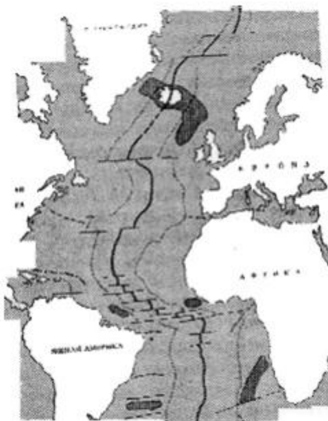
Срединно-Атлантический хребет, возникший на том месте, где Европа и Америка разошлись между собой задолго до гибели Атлантиды

М. Старк Гарднер думает, что в эоценовый период все Британские острова составляли часть одного большого острова, или вернее материка среди океана, и он полагает, что, тогда «существовала большая континентальная страна там, где ныне находится море», и что «Корнуоллис, острова Сицилийские и Британского канала, Ирландия и Бретань — все это остатки его самых возвышенных вершин».