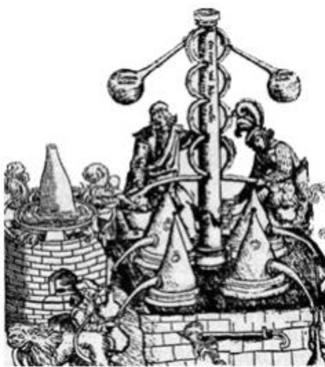
Атанор (печь) алхимиков Средневековья чье искусство через Египет восходит к Атлантиде.

Много придавалось значения изучению свойств растений и их целительных качеств. В те времена специально медицинских учреждений не существовало; каждый образованный человек более или менее был знаком с медициной и методами лечения магнетизмом. Преподавалась также химия, математические науки и астрономия. В наши дни мы тоже приняли за преподавание этих наук; но главной задачей учителя того времени было раскрытие психических сил ученика и изучение сокровенных сил природы. Оккультные свойства растений, металлов и драгоценных камней, так же как и химические процессы превращения металлов входили в задачи этого образования.